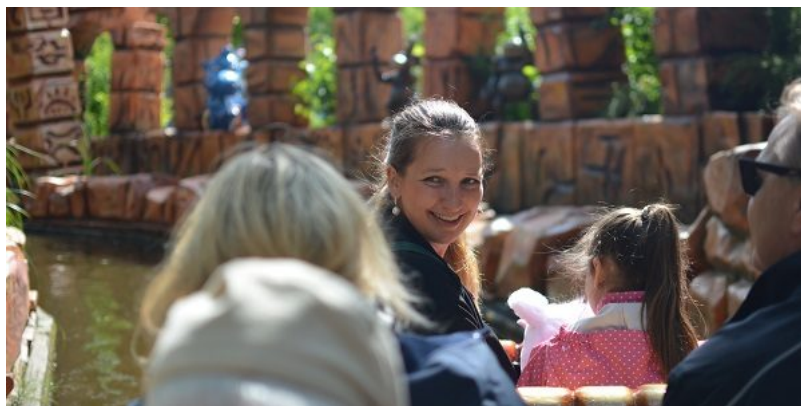
Soloven var også et hit hos hele familien.